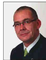
412 Engel Adolf