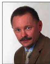
409 Graf Roland